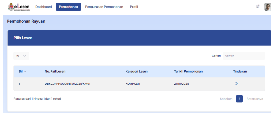
Rajah 3: Permohonan Rayuan > Pilh Lesen