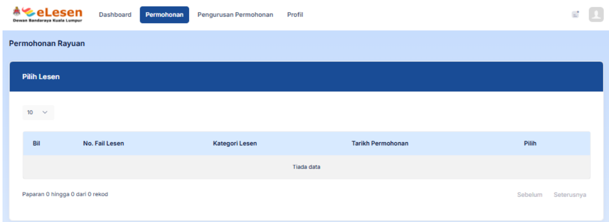
Rajah 2: Permohonan Rayuan