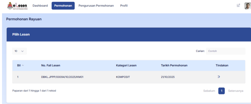
Rajah 3: Permohonan Rayuan > Pilh Lesen