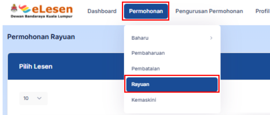
Rajah 1: Permohonan > Rayuan