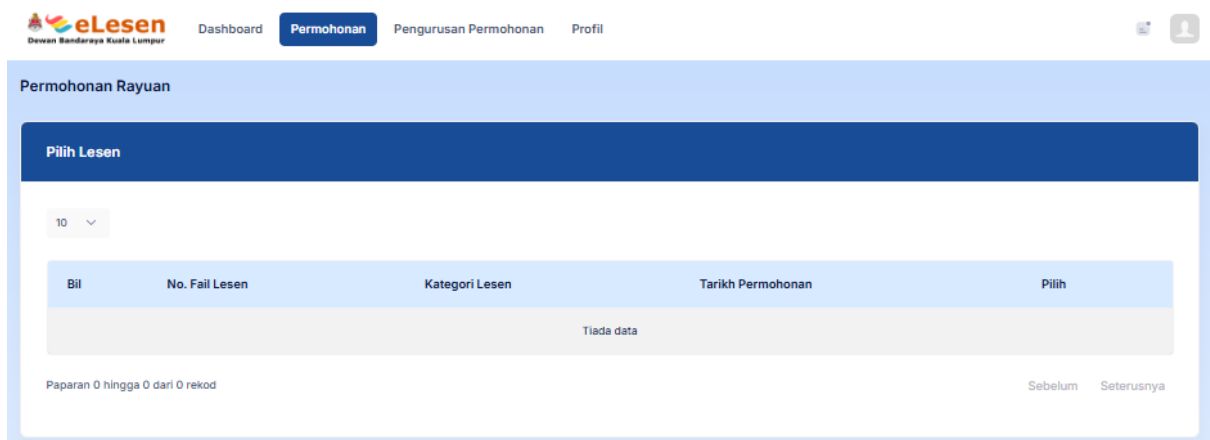
Rajah 2: Permohonan Rayuan