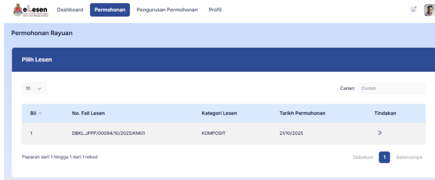
Rajah 3: Permohonan Rayuan > Pilh Lesen