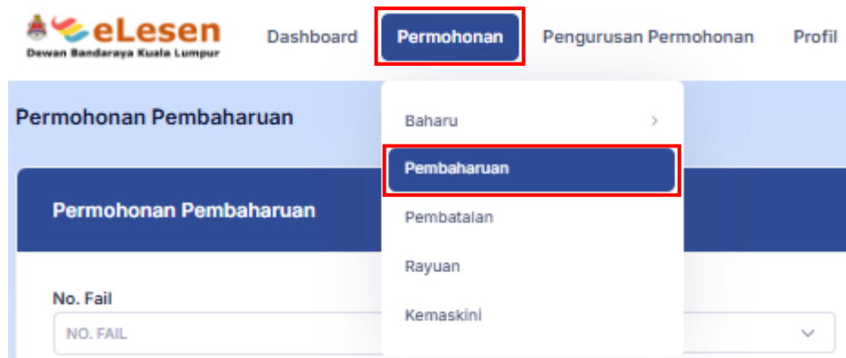
Rajah 1: Permohonan > Pembaharuan